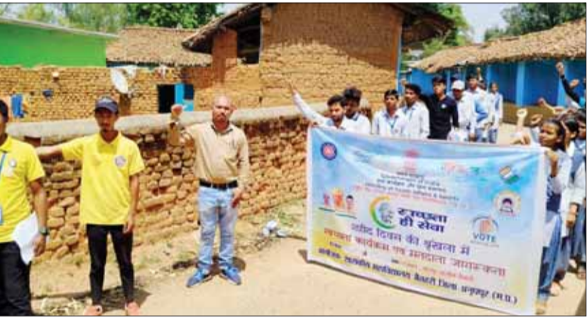
रंगोली बनाकर मतदान करने का दिया संदेश